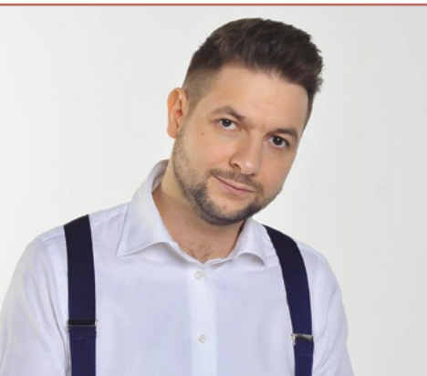
Patryk Jaki, europoseł i były wiceminister sprawiedliwości.

P.J. Cenzurowanie treści stało się niemal popularne na facebooku i twitterze. Ta ustawa jest więc po to, by bronić czegoś fundamentalnego dla państwa, cywilizacji zachodniej i Polski, tzn. wolności, wolności debaty czy wymiany myśli; bo jeśli mielibyśmy wrócić do sytuacji jaka była w PRL-u, gdy myśleć można było wszystko, pod warunkiem, że były to myśli komunistyczne, to osłabimy państwo. Z takimi tendencjami trzeba stanowczo walczyć.