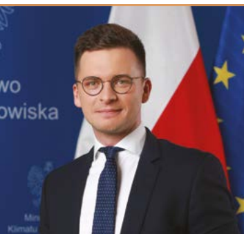
Aleksander Brzóška – Rzecznik Prasowy Ministerstwa Klimatu i Środowiska

Inwestycje w odnawialne źródła energii przyczyniają się również do tworzenia nowych miejsc pracy. Rozwijający się sektor energii odnawialnej wymaga zaawansowanych technologii, infrastruktury, konserwacji i zarządzania, co prowadzi do zwiększenia zapotrzebowania na wykwalifikowanych pracowników. Lokalne społeczności i regiony, które postawią na rozwój odnawialnych źródeł energii, mogą skorzystać z nowych możliwości zatrudnienia i wzrostu gospodarczego.